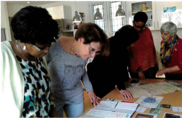
Module de formation : consolider ses techniques d'animation par des activités ludiques.